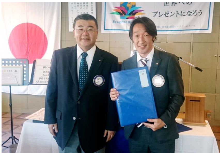
大家会長と会員誕生日の平山会員